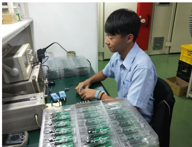
圖 3-2-4 工作環境