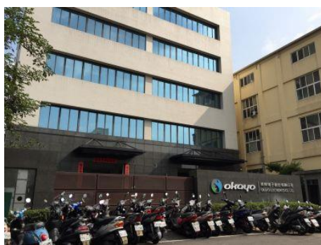
圖 3-2-3 公司正門