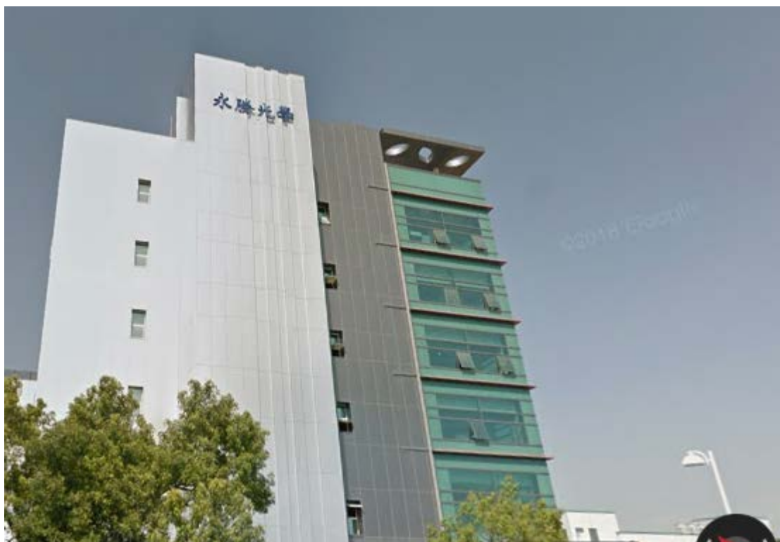
圖 1 永勝光學股份有限公司外觀