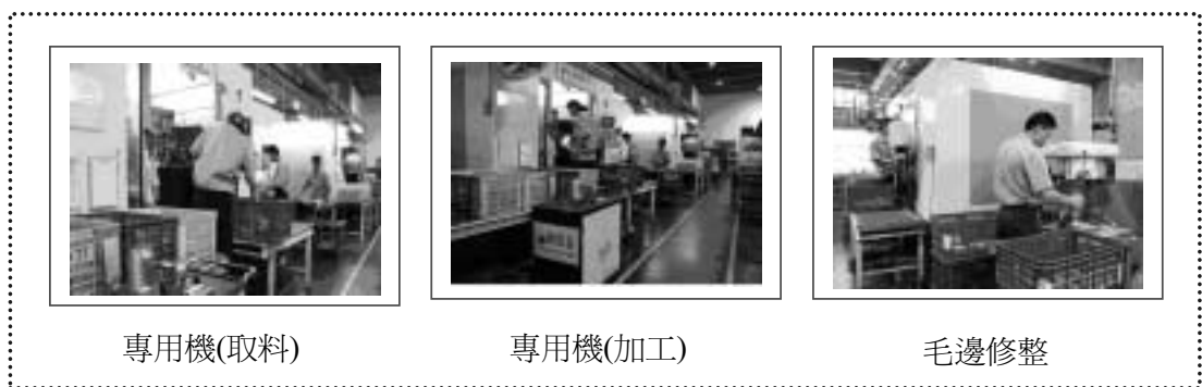
圖三：改善後之現場照片

衡量製程品質績效的良窳，一般實務以不良率或製程能力來評量。本個案持續改善之不良率，從改善前的1.12%至改善後的0.08%，經整理後如表十所示。