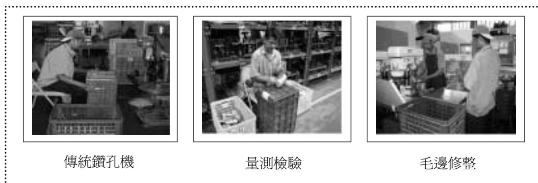
圖二：改善前之現場照片