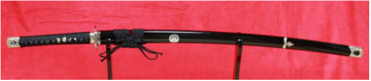
圖 3. 宗左三文字