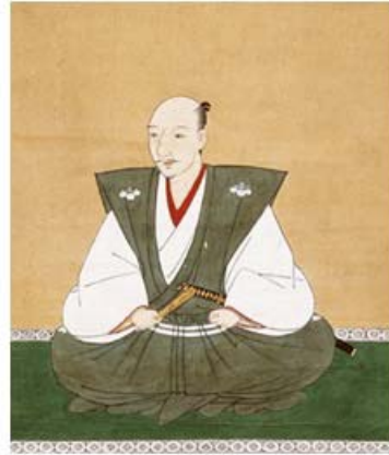
圖 1. 織田信長

織田信長（おだのぶなが；請參照圖 1）為戰國・安土桃山時代中有名的武將，與豐臣秀吉、德川家康並稱為「三英傑」，也是造就之後「終結戰國動亂、全國統一」的人物（相賀，1985）。