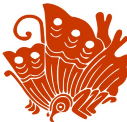
圖 6. 揚羽蝶