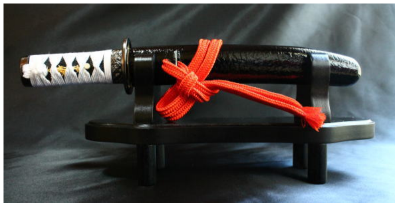
圖 4. 薬研藤四郎（引用自模造刀販売むしゅ処）

刀名の由來為室町期代の武將畠山政長想以此刀切腹而履試無法成功，憤而丟棄時剛好貫穿磨製藥粉的研鉢而來。為織田信長の愛刀，在本能寺之變時被燒毀（知恵袋, 2014）。