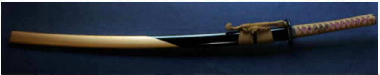
圖 2. 压切長谷部

信長為了褒賞提出攻打毛利輝元策略的黑田孝高(くろだよしたか；一般稱為黑田官兵衛)，而賞賜給他，之後成為了黑田家的傳家寶（維基百科, 2015）。