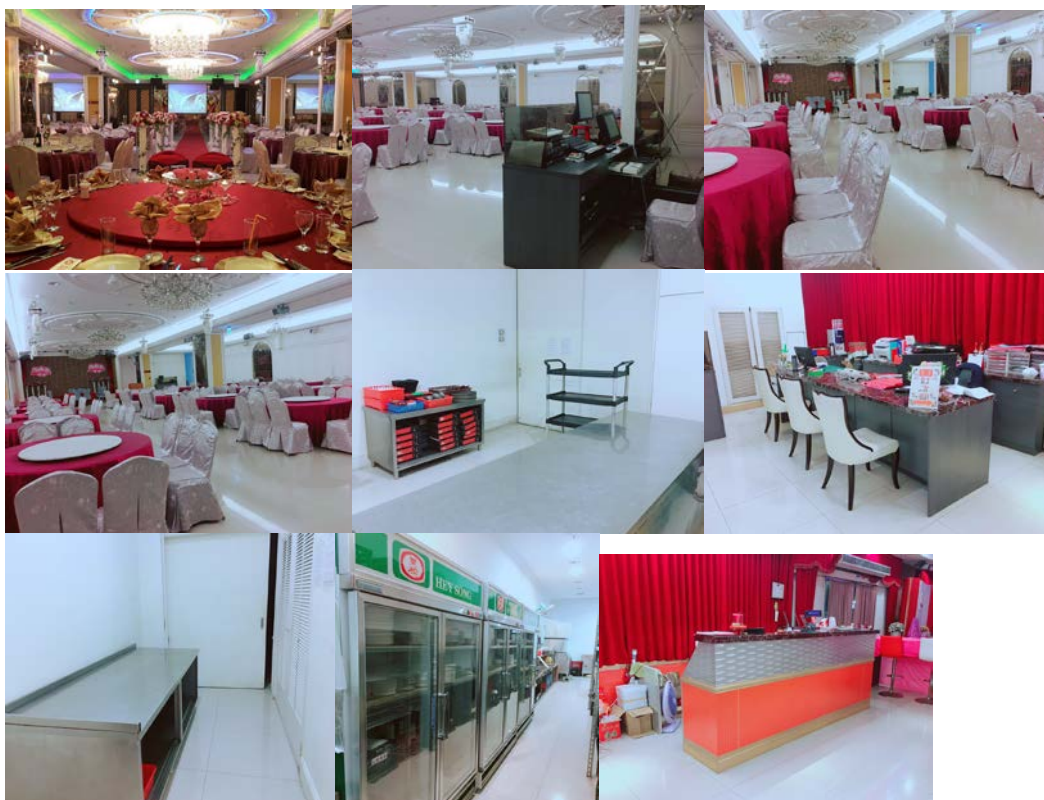
圖 3-2 工作環境與同事