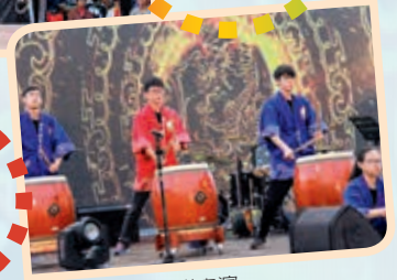
▲應日系和太鼓隊表演