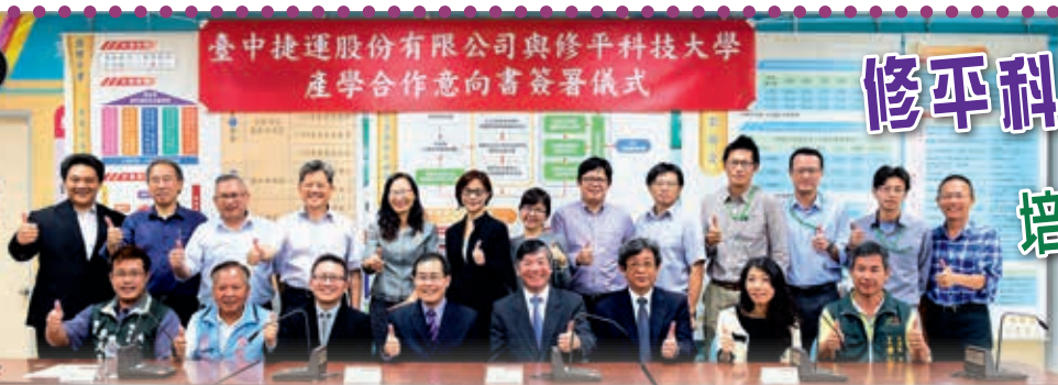
臺中捷運股份有限公司與修平科技大學 產學合作意向書簽署儀式

校址：臺中市大里區工業路十一號 電話：(04) 2496-1100 傳真：(04) 2496-1187 印製：興台彩色印刷股份有限公司 電話：(04) 22871181