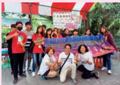
▲觀光系師生以田中在地農產品開發手做餅乾，於二水國際跑水節愛心義賣。

為了發展在地的觀光，本校觀光與遊憩管理系社區創意觀光發展中心秉持著大學社會責任以及專業融入服務學習的精神，與田中鎮中潭社區發展協會合作，透過系上「遊憩活動規畫實作」及教育部創新先導計畫的課程，指導學生結合田中在地具有觀光潛力的自然人文與地方產業，規劃「戀戀卓乃潭農村小旅行」深度游程，期待藉由觀光系專業的投入協助田中鎮發展在地的深度旅遊，同時提供系上學生觀光遊憩專業實踐的平台，讓年輕人的創意及能量與地方的需求相結合，藉由學生及學校能量的挹注，為田中小鎮的觀光產業注入更多的動能。