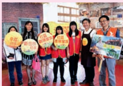
▲觀光系師生、中潭社區志工、彰化縣文化局長陳文彬(右二)合影。