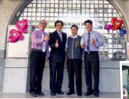
▲空氣品質智慧化資訊看板啟用合影