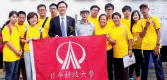
▲駐泰國大使董振源與修平國際志工隊合影