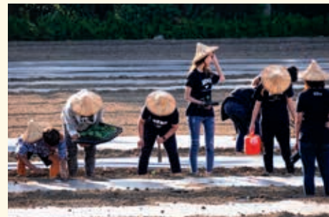
▲學生努力學習種栗子南瓜

參與學生覺得這樣的體驗農作非常有收穫，不但了解友善農業，也深深體會農民的辛苦，而他們可以參與，真是非常的「酷」，因為他們超越酷熱的天氣。透過農委會農業改良場技術指導，大學服務學習人力提供，青年農民在地深耕下，台灣農業的缺工問題，或許可以找到異於打工度假的另一個解決方案。