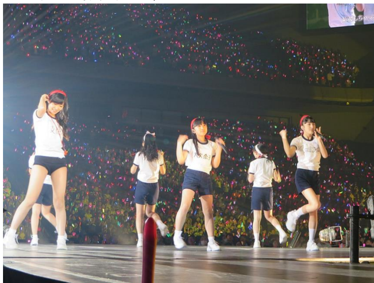
(圖)2-2-4 AKB48 小分隊 HKT48

HKT48是日本大型女子偶像團體 AKB48的姐妹團之一，由作詞家秋元康擔任總製作人，以福岡市為主要活動據點的女子偶像團體，成立於2011年，團名源自福岡的地名博多（羅馬拼音為HAKATA）。HKT48是繼SKE48和NMB48之後，第三個依照AKB48的運作概念所成立的地方性姊妹團體，曾在福岡市郊的福岡海鷹城（Hawks Town）擁有專屬表演劇場（已於2016年3月停業），目前主要使用位於福岡天神「Solaria Stage」商場內的「西鐵表演廳」進行劇場公演。大部分成員都出身自九州地方各縣。