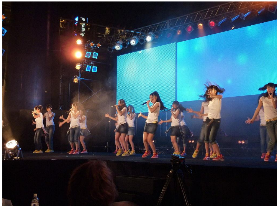
(圖)2-2-2 AKB48 小分隊 SKE48

SKE48是日本大型女子偶像團體 AKB48的第一個姐妹團，於2008年出道，以其專屬表演劇場所在的名古屋及東海地方為中心活動，雖然是AKB48的姊妹團體，總製作人也由秋元康擔任，但是兩者存在許多不同之處，例如成員主要出身於東海地方（特別是名古屋所在的愛知縣），且大部份皆隸屬同一經紀公司。