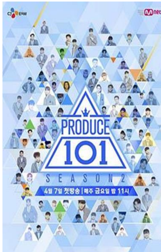
(圖)2-1-2 PRODUCE101 第二季海報

《PRODUCE 101 第二季》是韓國Mnet頻道在2017年推出的韓國第一個「經紀公司大型企劃男團」新男團選拔生存實境節目，節目以《PRODUCE 101》第一季作為藍本，以101名來自不同經紀公司的男練習生作為主角，在節目中同吃同住、完成各種任務，最後獲選的11名成員將會組成一個團體，並以YMC娛樂旗下藝人的身份進行為期1年6個月的活動至2018年12月31日。節目最終回中公布團體名為Wanna One。