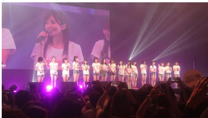
(圖)2-2-3 AKB48 小分隊 NMB48

NMB48是日本大型女子偶像團體 AKB48的姐妹團之一，以其專屬劇場所在的大阪及關西地方為中心活動，總製作人為作詞家秋元康。於2010年10月正式披露的NMB48是繼SKE48之後，第二個根據AKB48的概念而創立的地方性姊妹團體，名稱源自專屬劇場所在的大阪市內商圈難波（羅馬拼音為「NAMBA」）。團體營運者與成員所屬經紀公司為吉本興業旗下子公司Showtitle。