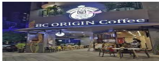
圖2-1 8C Origin Coffee

8C 咖啡成立於2000年，巴西同時也是全世界咖啡最大出港口我們取諧音數字8C 乃是出自於趣味2000正式成立8C 尚未有任何咖啡連鎖品牌累積23年有餘的門市的經驗，熱愛咖啡成癮的執行長，從門市到烘豆開始進入Ai 手沖及Ai 智能烘豆的世界，2022年榮獲 Ai 烘豆曲線服務創新，匯集8C 的23年的烘豆參數，成立 Ai 烘豆實驗以虹吸手沖咖啡和自家烘培咖啡豆聞名並獲得多項國內外的獎項和肯定。8C 咖啡也致力於推廣咖啡文化和教育，與大學合作開設咖啡學分班，並提供咖啡考證中心。