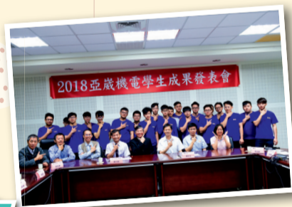
▲修平科大學生在亞威機電實習

修平科大在課程上，配合企業界的需求，進行彈性調整，隨著時代的日新月異，不斷更新內容，務求理論與實用並重，將校園與社會的落差，降至最低。學生經過這樣的養成訓練，能夠具備合格的實務操作能力，更重要的，在過程中，建立他們對自己的信心，和對事物的負責態度。