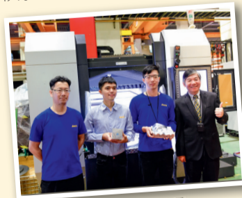
▲亞威機電實習探師徒制傳承