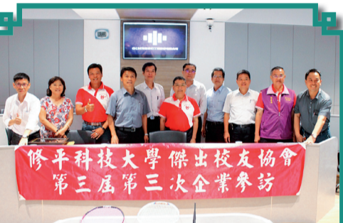
修平科技大學傑出校友協會 第三屆第三次企業參訪