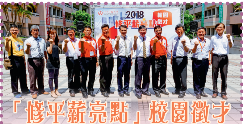
▲修平薪亮點 校園徵才