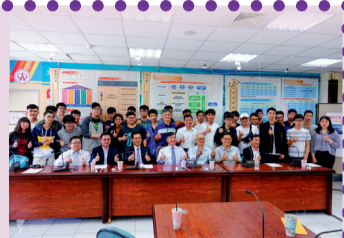
▲二代工管人薪火相傳合影

民國73年梁教授自台大碩士班畢業後，因領取教育部專科師資獎學金被分發到樹德工專任教，「69級乙班」是梁教授第一年執教的導師班級。梁教授回想當年說，自己年輕又是南部人的純樸熱忱性格，和當時正值青春叛逆期的同學們能融成一片，建立了深篤濃厚的情誼，真是不容易。用關懷、用身教，把學生當作自己的子弟照顧。今天「69級乙班」同學事業有成，抱著感恩心情回饋母校，梁教授深感榮焉。